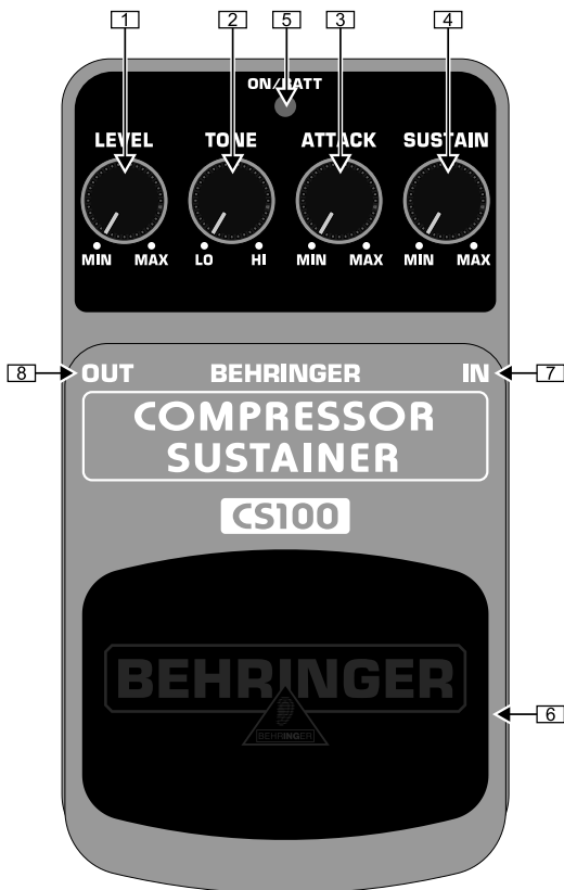
Обзор верхней части