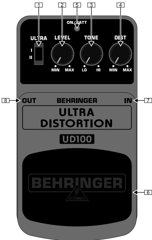
Обзор верхней части